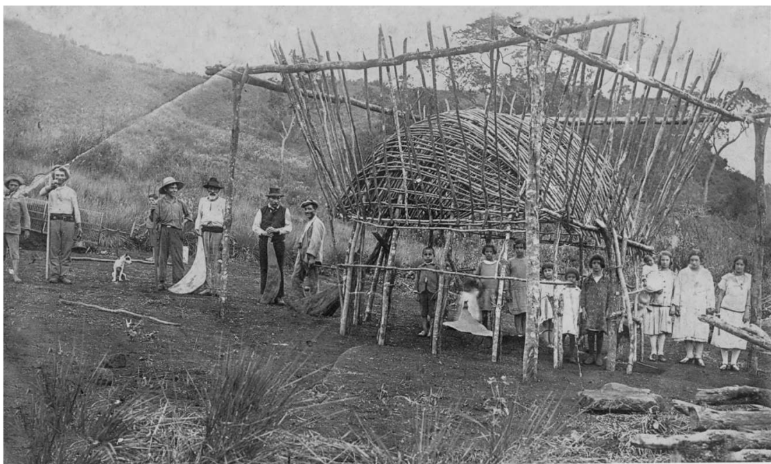
Enero 8 de 1928 Profundidad

Por un lado, hay monopolizado la venta de productos estándar, de modo que se van